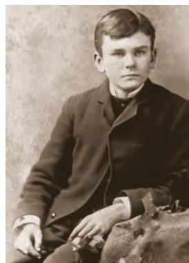
Photo non datée de Michael McGivney, jeune garçon.