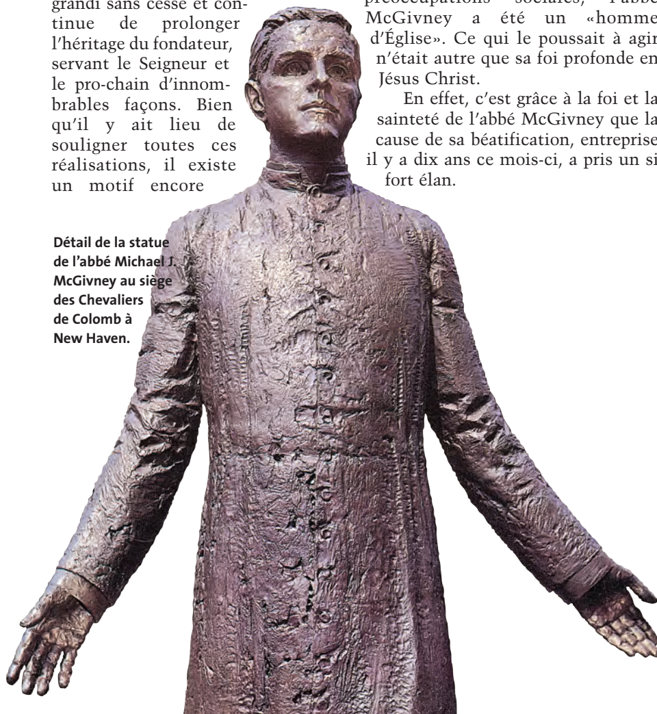
Détail de la statue de l'abbé Michael J. McGivney au siège des Chevaliers de Colomb à New Haven.

Dans le cas de l'abbé McGivney, une enquête sur une guérison mirac-